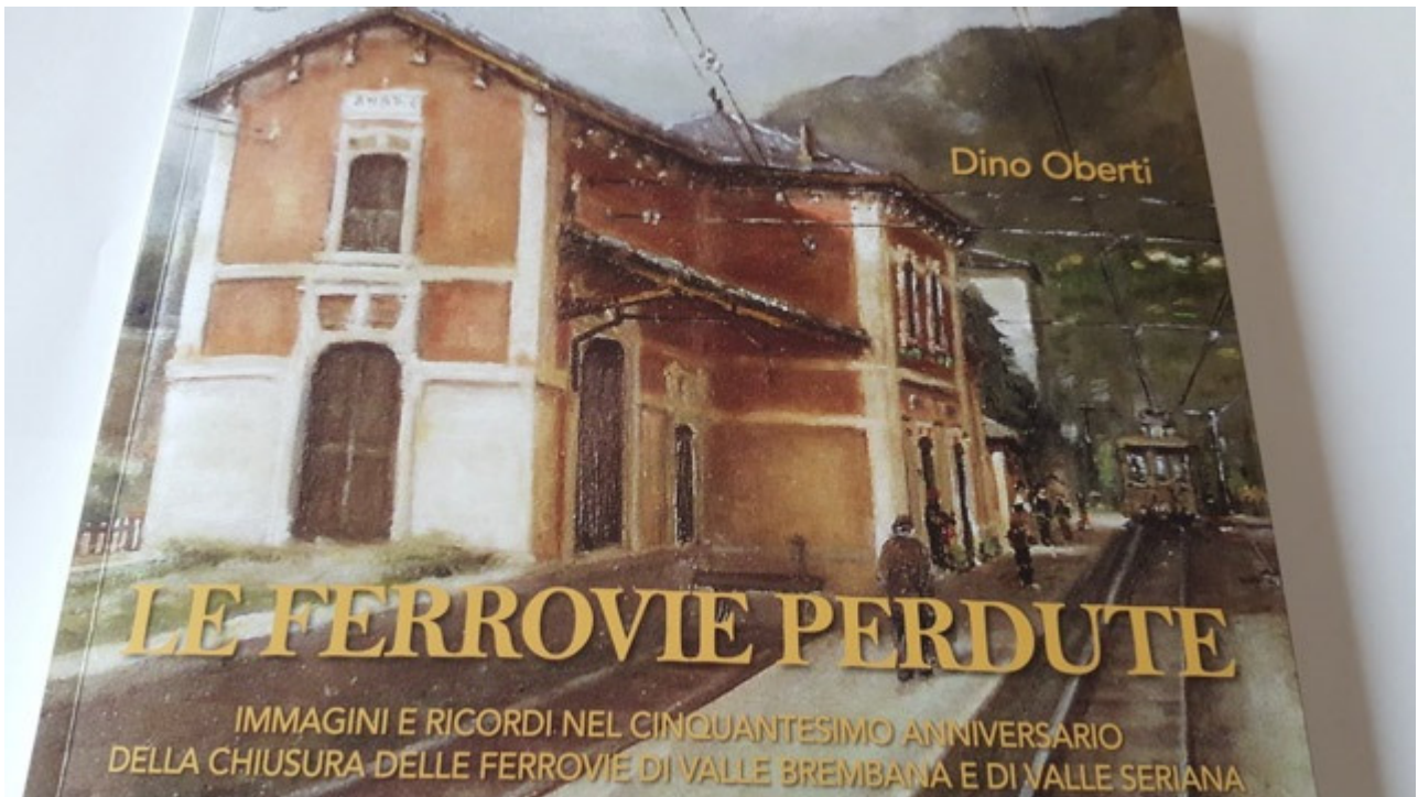
Il libro Le Ferrovie Perdute