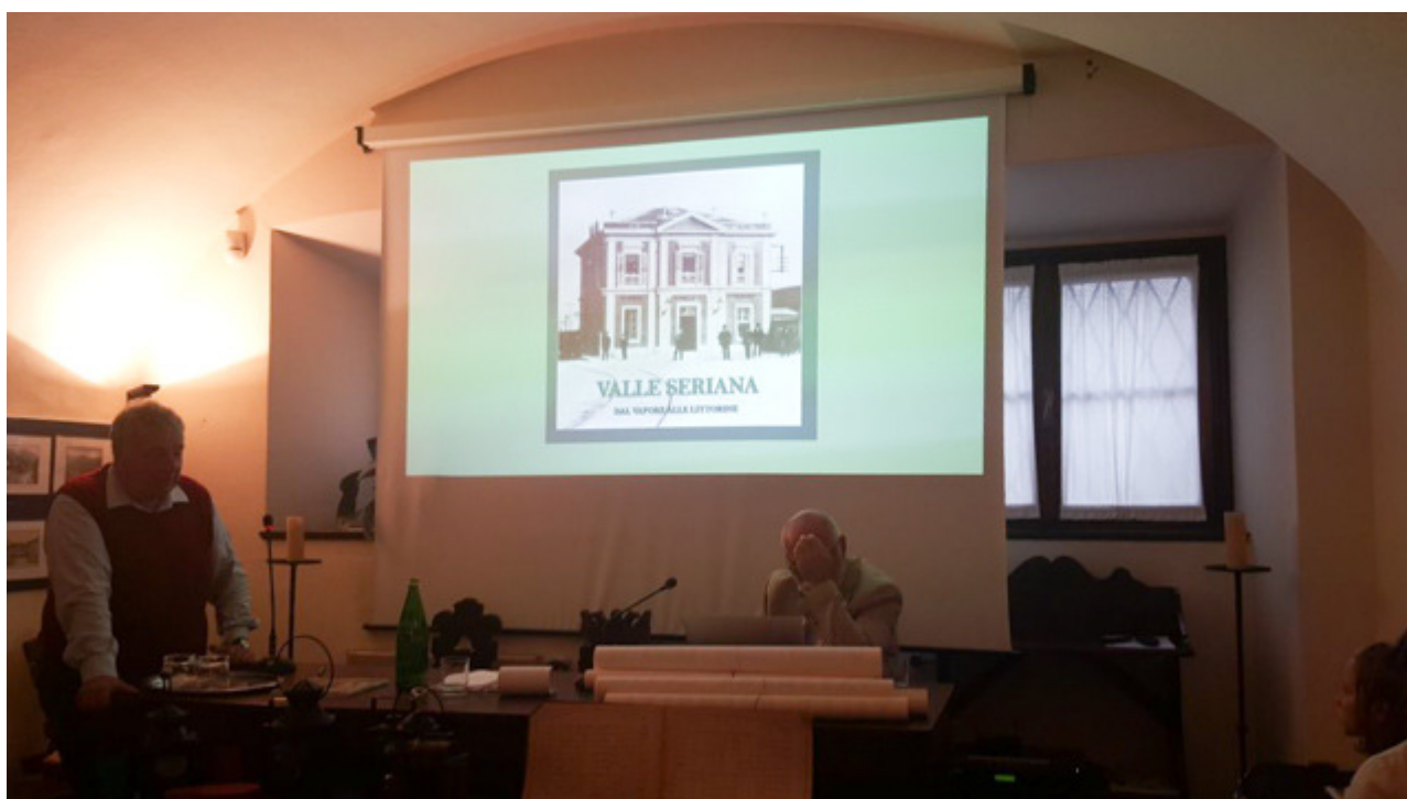
Presentazione del libro Le Ferrovie Perdute a Zogno, un momento dedicato alla Valle Seriana